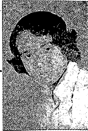
শ্ৰীসত্যেন্দ্ৰ নাথ বড়া বছৰৰ শ্ৰেষ্ঠ অভিনেতা ১৯৭৭-৭৮