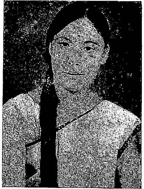
মিচ্, নমেশ্বৰী বড়ো বছৰৰ শ্ৰেষ্ঠা খেলুৱৈ