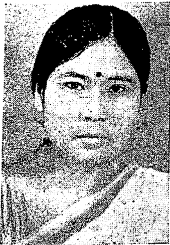
মিচ্, হীৰা বাতা বছৰৰ শ্ৰেষ্ঠা গায়িকা