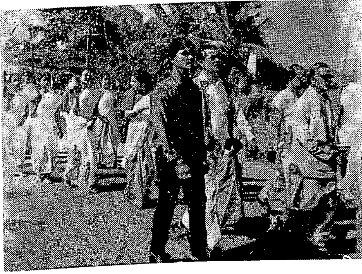
কপালী জয়ন্তী উপলক্ষে হোৱা সাংস্কৃতিক শোভাযাত্ৰাৰ একাংশ