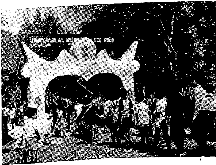
ৰূপালী জয়ন্তীৰ বাবে নিৰ্মিত তোবণ