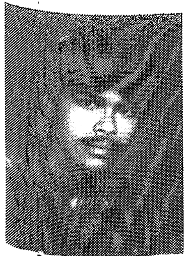
শীকান্দের কলিতা ( উ: মা: ২য় বাৰ্ষিক ) বছৰ শ্ৰেষ্ঠা খেলুৱৈ