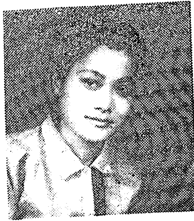
মিচ অঞ্জলি দৈমাবা ( উ: মা: প্ৰ: বাৰ্ষিক ) বছৰ শ্ৰেষ্ঠা খেলুৱৈ