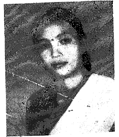
মিচ প্ৰহ্মী পাঠক ( স্নাতক প্ৰ: বাৰ্ষিক ) বছৰ শ্ৰেষ্ঠা গায়িকা