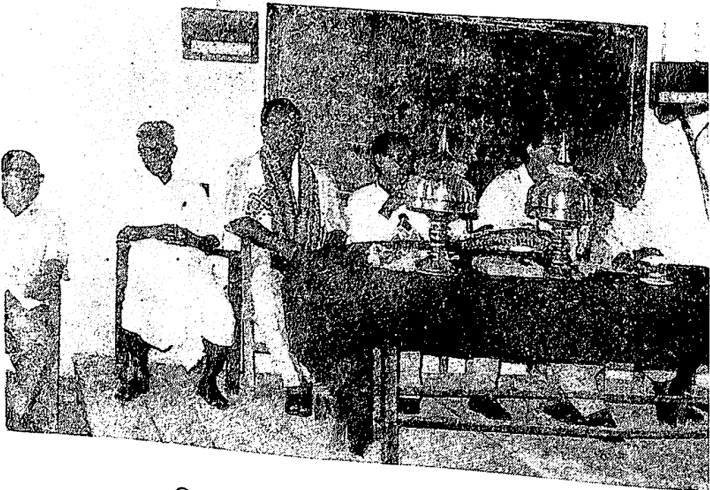
বিদায় সভায় জনোরা মুহূর্তৰ এটি বেঙনি