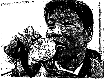
এম. চি. মেৰীকম