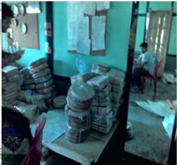
Fig – Various stages of Areca leaves-based processing like storing of raw materials, cleaning of leaves, processing of leaves in the burner and finally packeting of disposables.