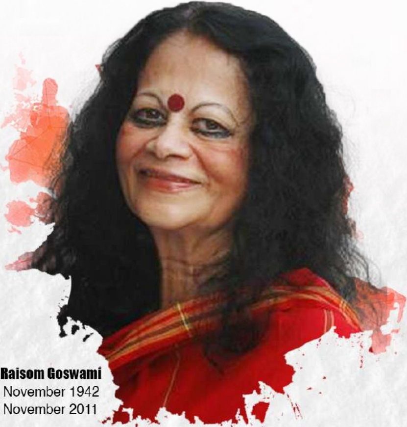
Mamoni Raisom Goswami Born: 14 November 1942 Died: 29 November 2011